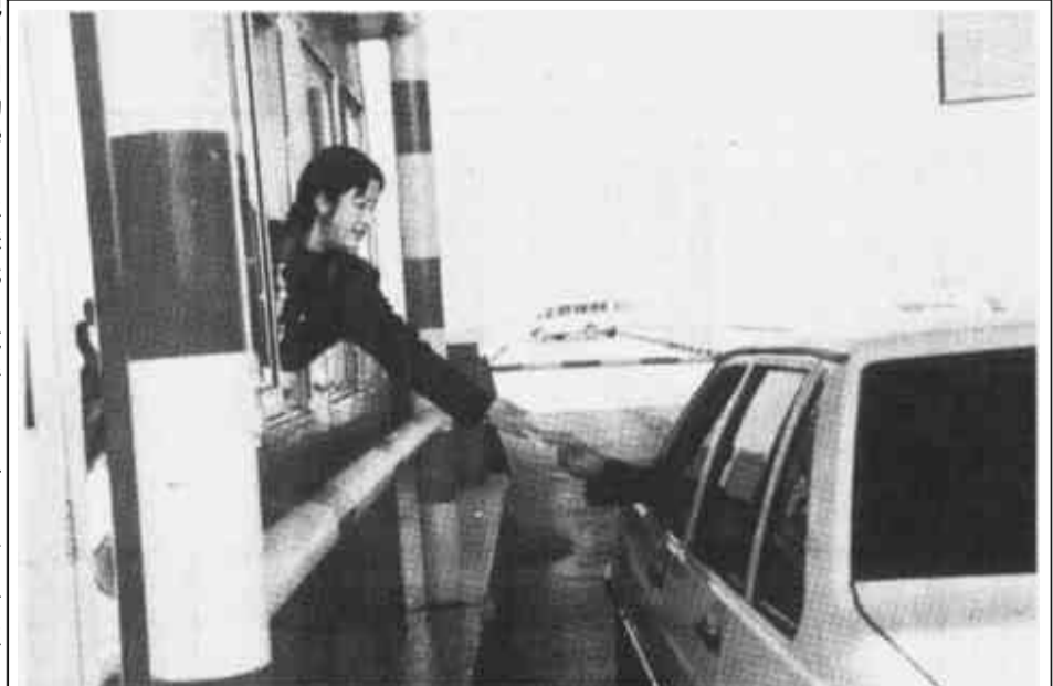
东营市公路局田庄收费站不断推出文明服务新举措，在春节期间，他们向过往司机赠送“行车安全卡”，受到广大司机的好评。