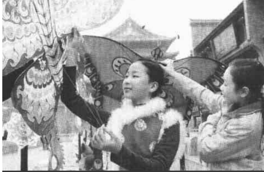
陕西西安的两名中学生在西安鼓楼广场选购风筝。春节期间在西安市各大广场购买和放飞风筝的市民络绎不绝,一派早春气息。

新华社济南2月19日电 (记者 宋振远) 山东省农业厅负责人近日对外宣布,“十五”期间,山东将建设绿色食品、无公害农产品生产基地3000万亩,主要包括瓜菜、果品、花生、优质小麦、食用菌和淡水养殖。届时,山东将成为全国规模最大的无公害农产品供应基地。 到2005年,山东经专门机构认证的绿色食品、无公害农产品将累计分别达到500个和600个,产品年产量分别达到400万吨和6500万吨,年出口创汇20亿美元,占全省农产品加工出口创汇总额的30%以上。 为实现这一目标,山东正建立健全无公害农产品检验检测体系。“十五”期间,山东将在蔬菜、瓜果、畜禽和水产品重点生产区域,建立10处省级农产品质量监测中心,负责全省基地及企业产品质量监测;原料生产基地比较集中的县(市、区)农业主管部门和加工企业,建立产品质量监测站,配备快速检测仪器,负责本地生产基地及企业农产品质量自检;绿色食品和无公害农产品专区建立农产品质量监测点。