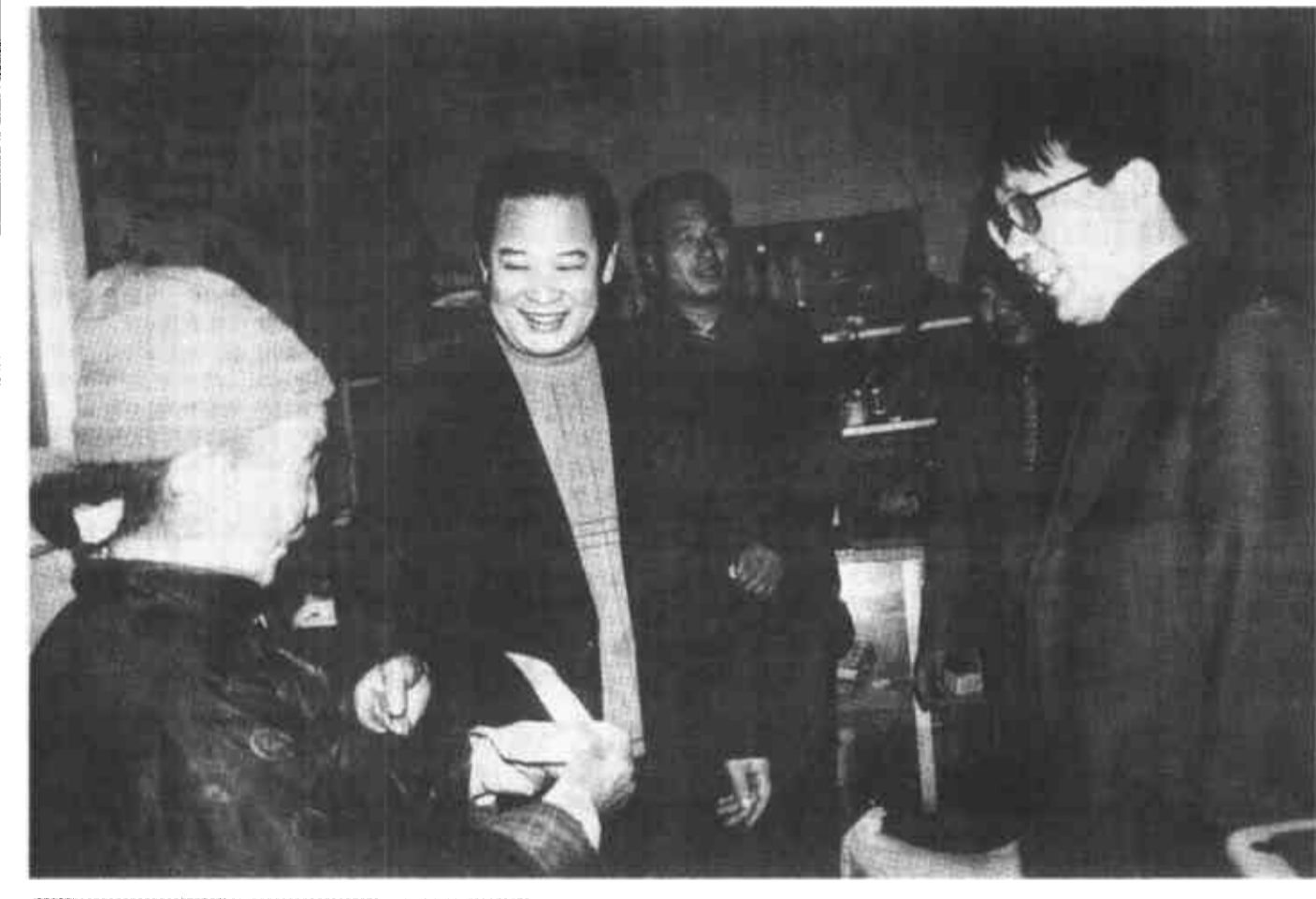
新春伊始，河口区建委积极扶持所包村的春耕生产，图为区建委负责人陪同区领导走访仙河镇新港村贫困户，为他们送上了扶贫支农款。